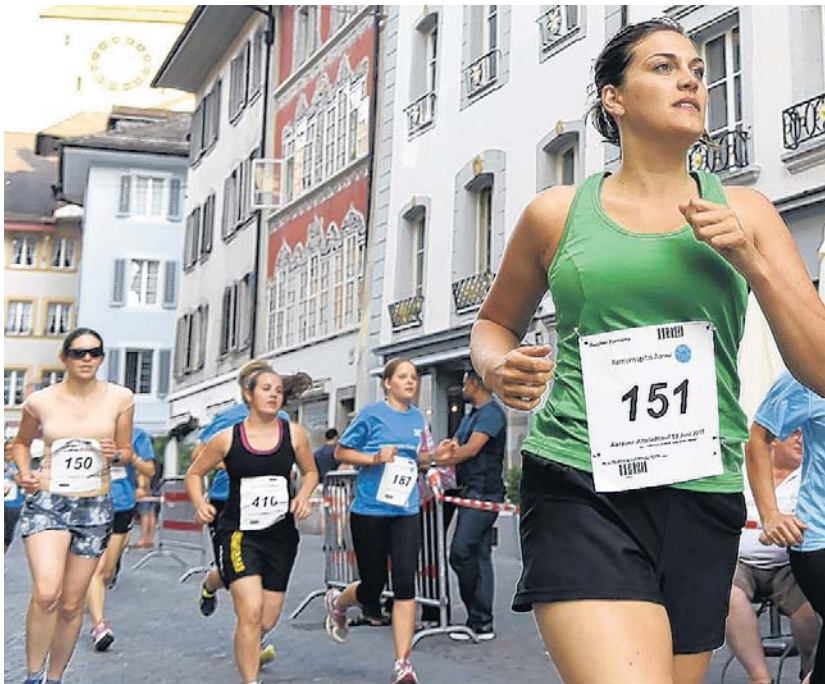
Der attraktive 2. Aarauer Altstadtlauf vom 18. Juni führt durch die malerischen Gassen