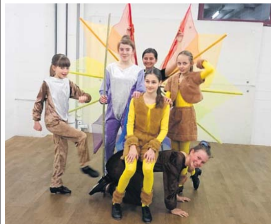
Steptanz ist ihre Leidenschaft: eine Gruppe der MignonDance Academy Aarau