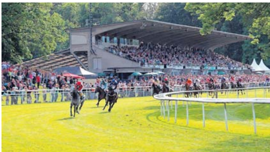
Auf der schönsten Rennbahn der Schweiz gibt es auch dieses Jahr wieder spannenden Pferderennsport

Pferderennen im Schachen Aarau lassen keine Wünsche offen. Sie bieten Spannung und Abwechslung pur! Dieses Jahr gibt es wieder vier Austragungen, am kommenden Sonntag, 22. Mai wird die Serie mit dem ersten Renntag gestartet.