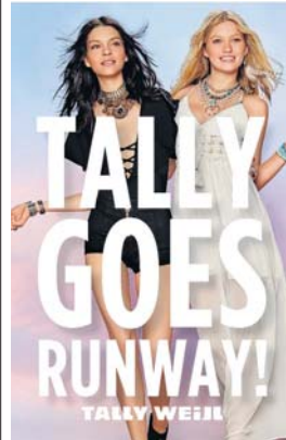
Frau zeigt sich diesen Sommer von ihrer femininen Seite: Inspirierende Sommermode an der Modeschau im City-Märt

Ein von der Sonne geküsster Teint, wahlendes Haar und dazu luftig leichte Maxikleider und schulterfreie Blusen – das sind nur zwei unwiderstehliche Trends dieses TALLY WEIJL-Sommers. Inspiriert von den Looks aus der Coachella-Wüste Kaliforniens lässt die neue Kollektion das Festival-Feuer aufblenden. Ob Fransen, Häkelmaterialien oder aufregende Spitzendetails, Frau zeigt sich diesen Sommer von ihrer femininen Seite. Kombiniert mit auffallenden Ketten und Armbändern wird der natürliche Gypsy-Look abgerundet.