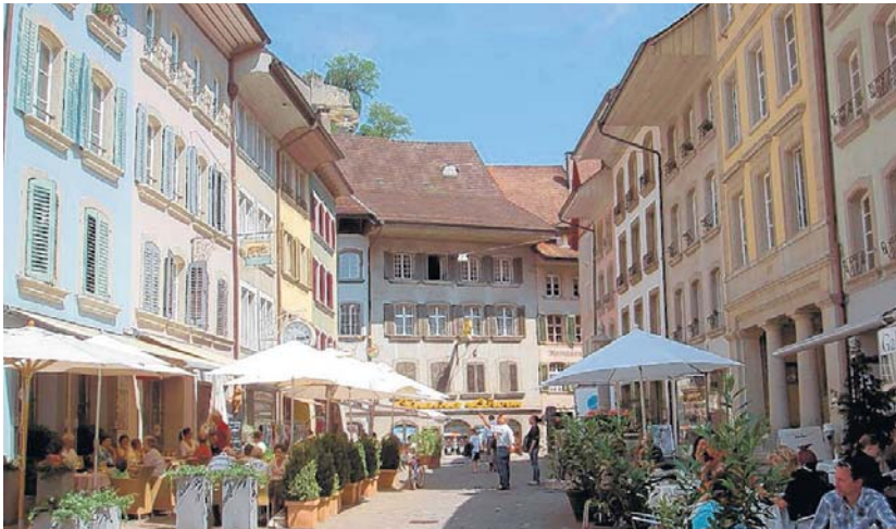
Die einzigartige Kulisse ist ein wichtiges und gemeinsames Prädikat der Aargauer Altstädte